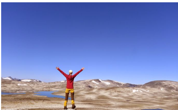
Abb.3 u. 4: Wanderer auf einem Fjäll, Nonne am Meer.

Ganz allgemein ist die Erfahrung, daß sich unser Seelenzustand in jenem irrational-mythischen Moment (Theobald 2003) abrupt ändert, in dem man, bspw. aus einem dichten Küstenwald kommend, plötzlich den explosiv sich weitenden Blick aufs Meer hat (Abb.3 u.4). Dieser Moment ist primär wortlos, wird aber emotional beantwortet. Die Erinnerung ist es im besten Falle auch.