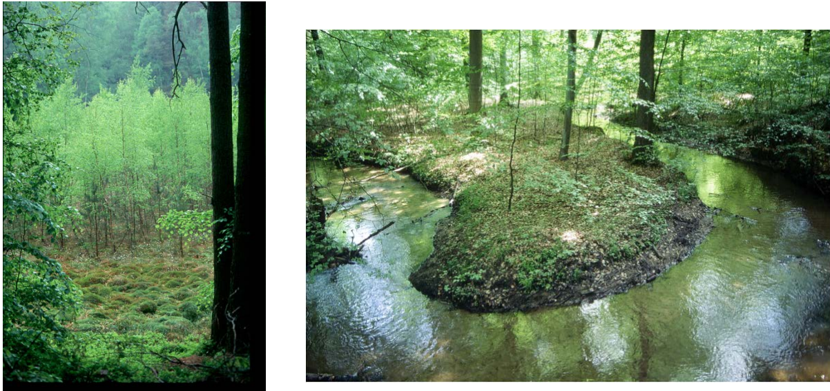
Abb. 7: Das Kesselmoor „NSG Mooskuten“ (li.) und der Waldbach „NSG Nonnenfließ“ (re.)

Ursprünglich wählte ich quasi unberührte Orte aus, da hier durch die Lebensvielfalt der ‚Geist‘ eines Landschaftsortes am deutlichsten zutage tritt. In Brandenburg fand sich da anfangs die Landschaft eines Kesselmoores (NSG) inmitten der hügelig buchenbestandenen