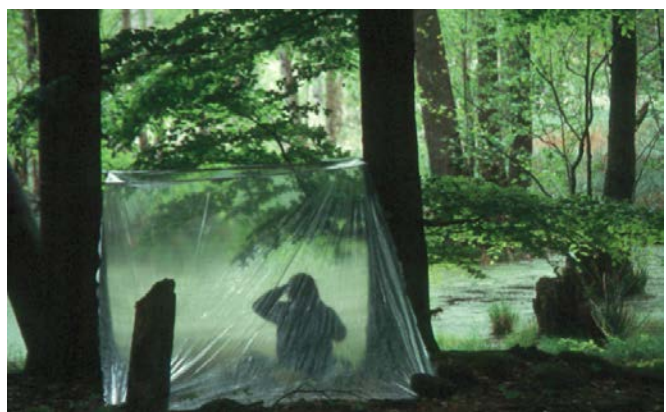
Abb. 5 u.6: Studenten der HNE Eberswalde an ihrem selbst gewählten Sitzplatz, hier an zwei unterschiedlichen Kesselmooren in der Choriner Endmoränenlandschaft.