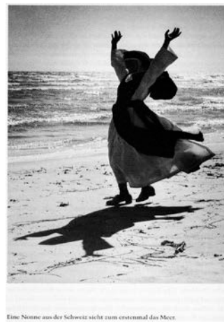
Eine Nonne aus der Schweiz sieht zum erstenmal das Meer.

(Quellen: Skjåk – The Holy Grail of Mountain Trout_Fishspot fishspot.no , https://fishspot.no/en/skjaak-holy-grail-mountain-trout-45878/ ) / Nørretranders, T. 1997: Spüre die Welt...Reinbek: Rowohlt: 587)