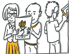
Interessierte aus der Wirtschaft (KMU)