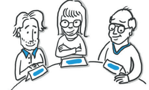
Nachhaltigkeitspioniere aus Wirtschaft und Gesellschaft