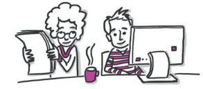
Mitarbeiter*innen öffentliche Einrichtung