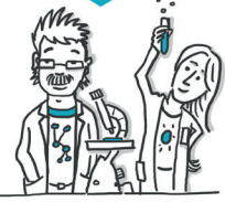
Wissenschaftler*innen anderer Einrichtungen

Transferverständnis der HNE Eberswalde: Transfer ist der wechselseitige und partnerschaftliche Austausch von Wissen, Ideen, Dienstleistungen, Technologien und Erfahrungen. Er umfasst alle Formen der Kooperationsbeziehungen zwischen der Hochschule und ihren externen Partner*innen in Lehre und Forschung – sowie darüber hinaus. Die Hochschule strebt einen Wissens- und Ideentransfer für eine nachhaltige Entwicklung an und möchte diesen als gemeinsamen Lern- und Gestaltungsprozess auf Augenhöhe mit Partner*innen aus der Gesellschaft realisieren.