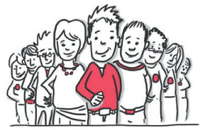
Vertreter*innen aus Zivilgesellschaft